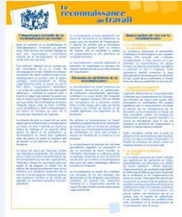
La reconnaissance au travail: une synthèse