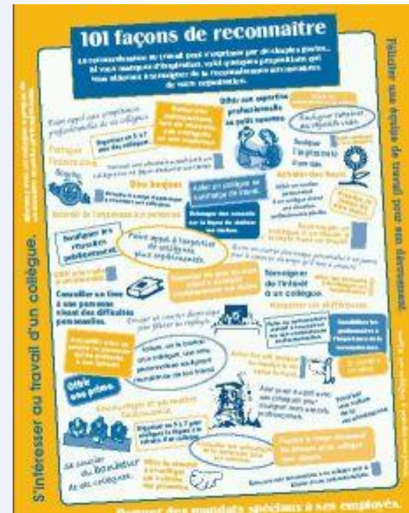
101 façons de reconnaître